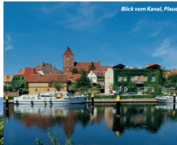
Blick vom Kanal, Plaue