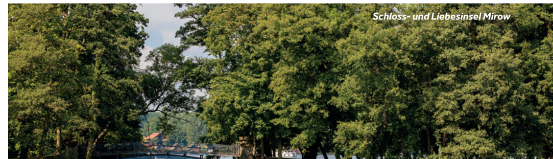
Schloss- und Liebesinsel Mirow

Restaurantempfehlung: Hotel und Restaurant „An der Seepromenade“ Einrichtungen vor Ort: Bäckerei, Metzger, Bank